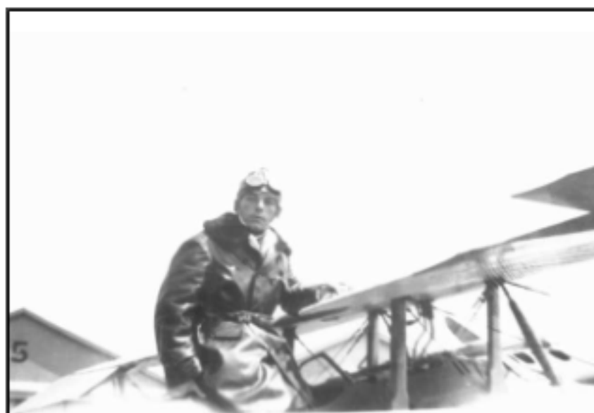
Giovanni Nicelli Asso dell'Aviazione