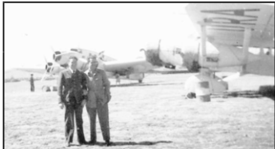
Immagini del Pilota Ulisse Molinari

E' sepolto nel cimitero del Verano a Roma.