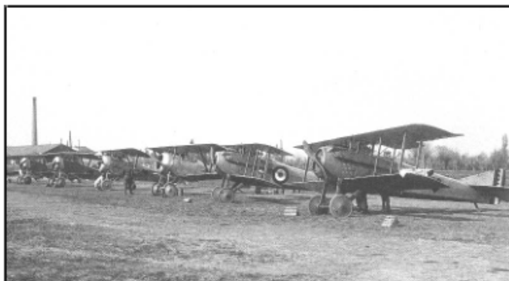
1917: Campo d'aviazione di Aiello sede della 77 o Squadriglia