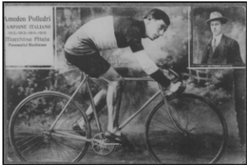
Polledri famoso campione del ciclismo