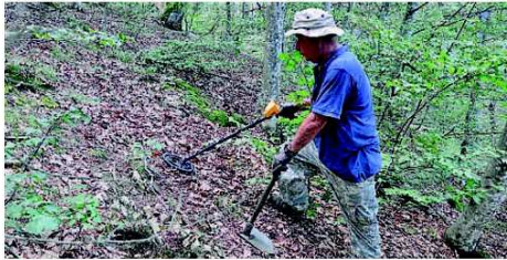
In alto, un bombardiere Wellington; sopra e a destra, due momenti delle ricerche dei piacentini