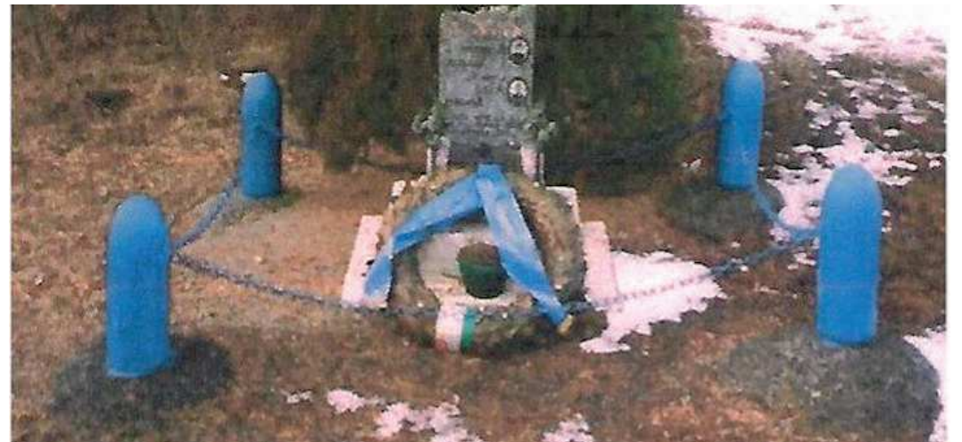
Il cippo che sul passo del Pelizzone ricorda i due piloti tragicamente scomparsi nel maggio '71

I due caccia si erano scontrati a causa del maltempo