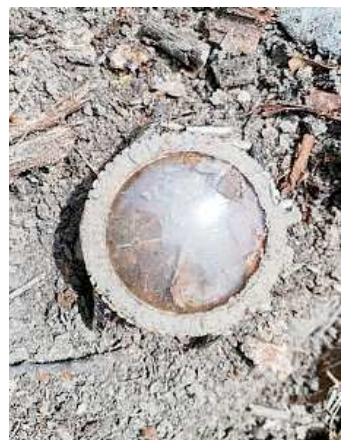
Il cronografo sul luogo del ritrovamento e, a destra, ripulito

Successivamente organizzano delle ricerche sul campo con i metal detector, per cercare eventuali frammenti aeronautici. Una volta rinvenuti i reperti che forniscono la garanzia di aver individuato l'esatto punto di caduta dell'aeromobile, lo mappano e consultando documenti nei vari archivi, cercano tutti i dati del volo, il tipo di velivolo impiegato e il nome degli aviatori coinvolti, per poi inserire i report della ricerca nel corposo sito del Grac (www.gracpiacenza.com) accessibile al pubblico. E' ormai una prassi consolidata per il