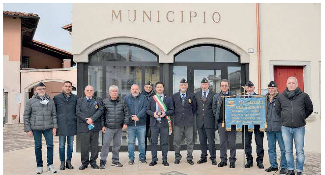
Il gruppo che ha partecipato alla cerimonia della consegna, in Friuli, a cui era presente anche il sindaco di Valvasone