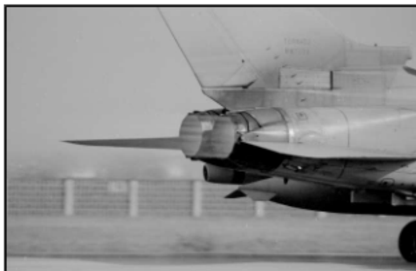
Tornado in decollo

Medaglia NATO per operazioni nella ex Jugoslavia Medaglia Nato per operazioni in Kosovo Croce commemorativa per missioni di pace in Bosnia Medaglia d'argento di lunga navigazione aerea