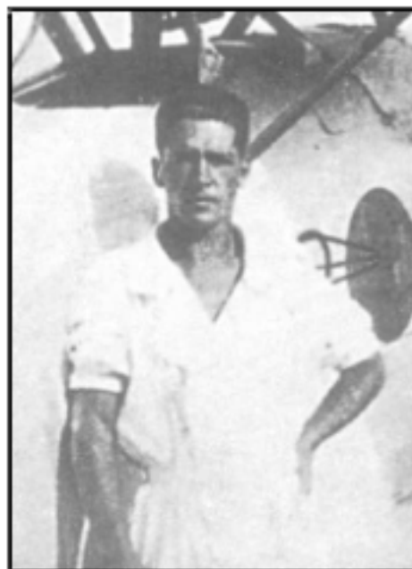
Castignoli in Africa.