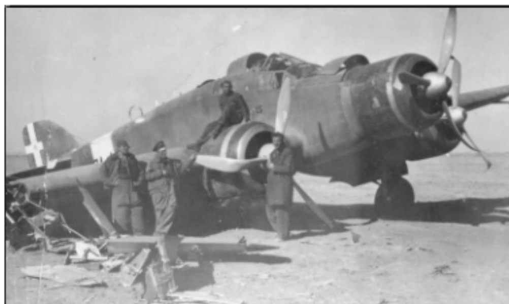
E. Cornelli il primo da sinistra