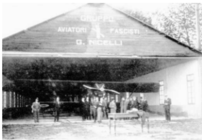
Hangar della squadriglia "Nicelli"

Il 3 marzo 1925, durante un volo di addestramento nel cielo di Torino, a causa di un'avaria del suo velivolo, precipita e perde la vita.