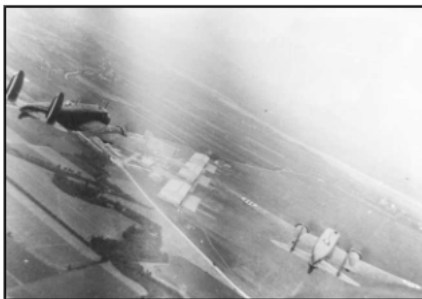
Aerei BR20 in fase di atterraggio all'aeroporto di S. Damiano (PC)