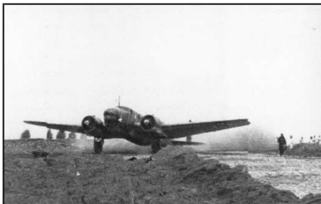
Un aereo pilotato da Ferrari Enzo